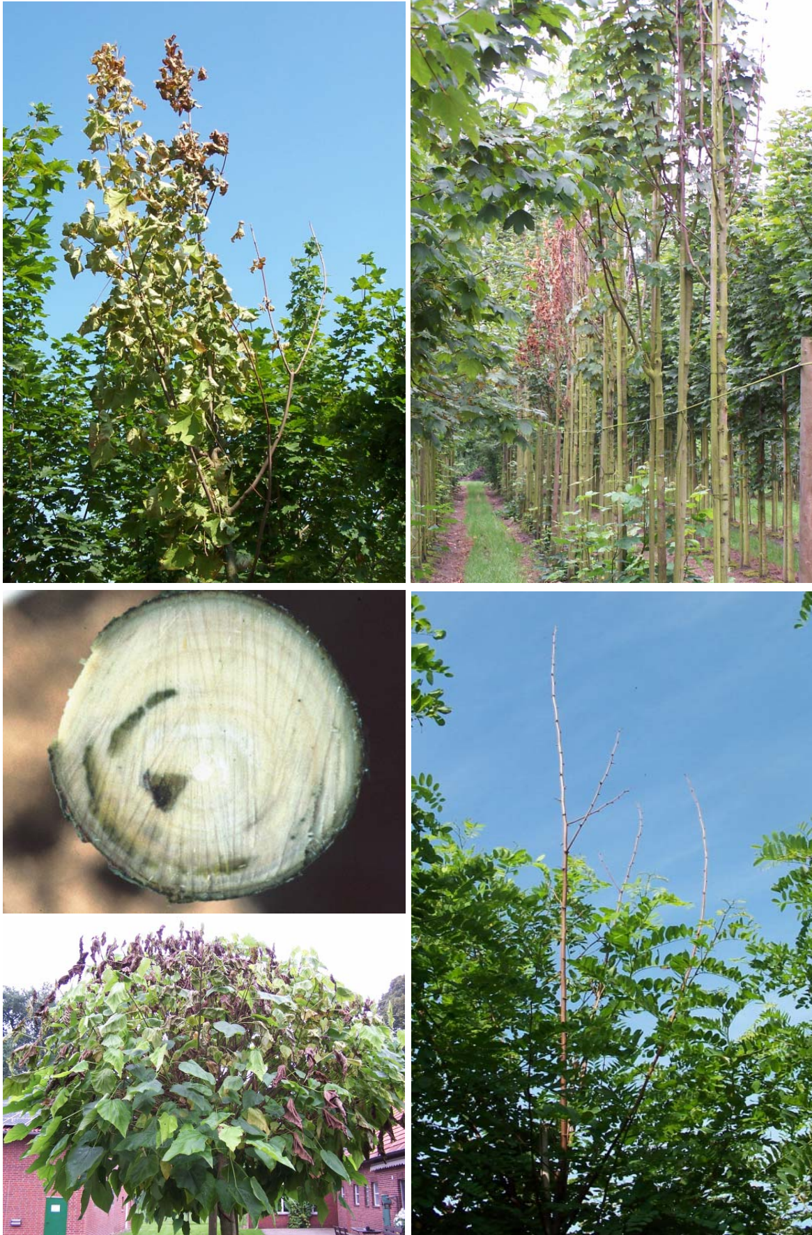
Abb. 1: Verticillium -Befall in der Praxis: Acer platanoides (oben links) und A. pseudoplatanus (oben rechts), Acer - Stammquerschnitt mit typischen Verbräunungen (Mitte links), Befall an Catalpa bignonioides (unten links) und Robinia pseudoacacia (unten rechts).