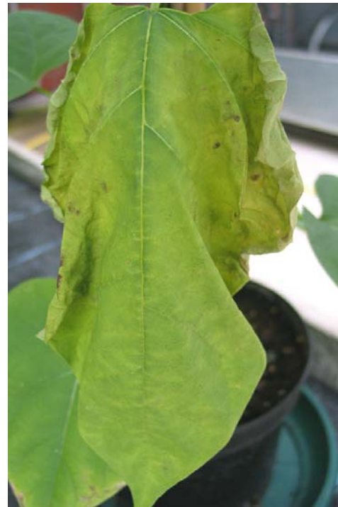
Abb. 4: Infektionsversuch mit C. bignonioides . Blattchlorosen (oben rechts), Blattnekrosen (unten links), welkendes Blatt (unten rechts).