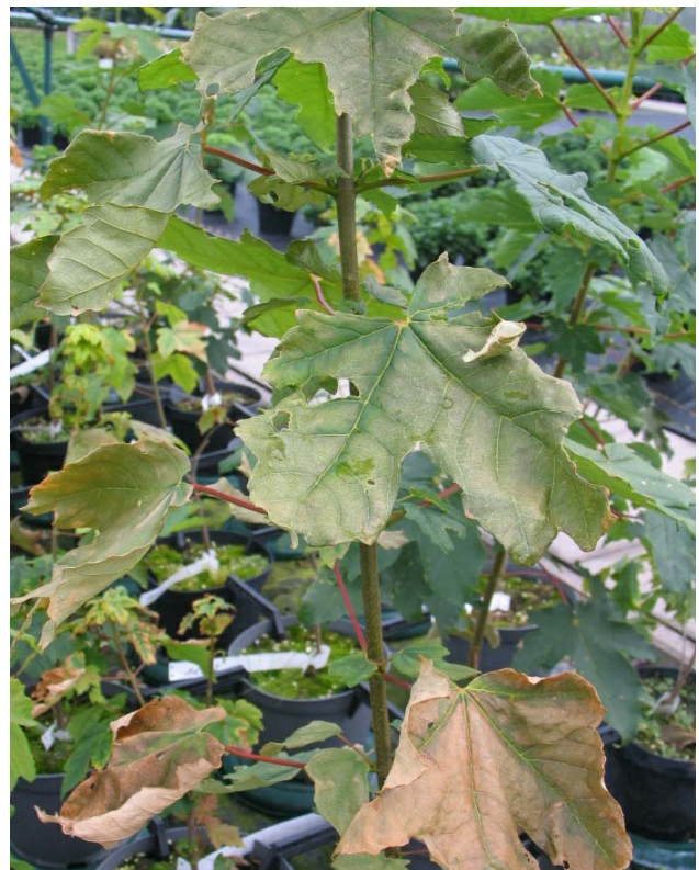
Abb. 5: Infektionsversuch mit A. pseudo-platanus . Blattchlorosen (oben rechts), Blattnekrosen (Mitte links u. rechts), welkende Pflanze (unten rechts).