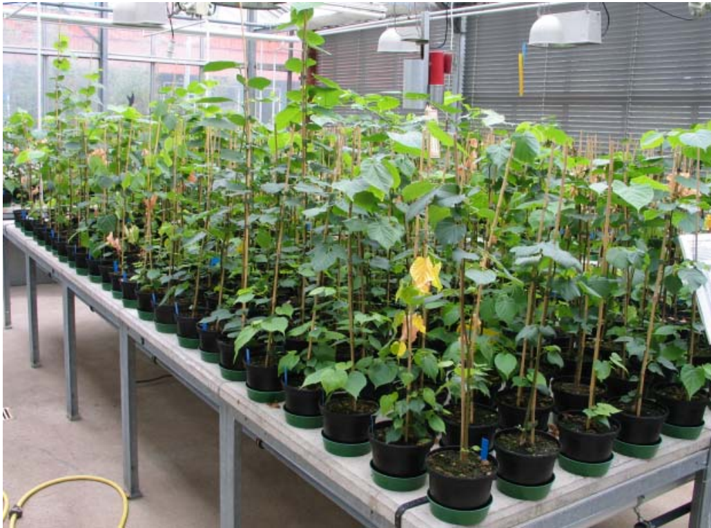
Abb. 3: Infektionsversuch mit Tilia cordata im Gewächshaus.

Über Reisolierungen konnte bei vielen Pflanzen eine Infektion nachgewiesen werden. Allerdings gelang der Nachweis nicht immer, so dass die Reisolierungsquote im Vergleich zur Pflanzenbonitur durchweg niedriger war. Die beiden V. longisporum -Isolate verursachten an mehr als 50 % der Pflanzen schwache Symptomausprägungen. In der abschließenden Laboruntersuchung konnte der Erreger nur bei Isolat 11/03 aus wenigen Pflanzen reisoliert werden.