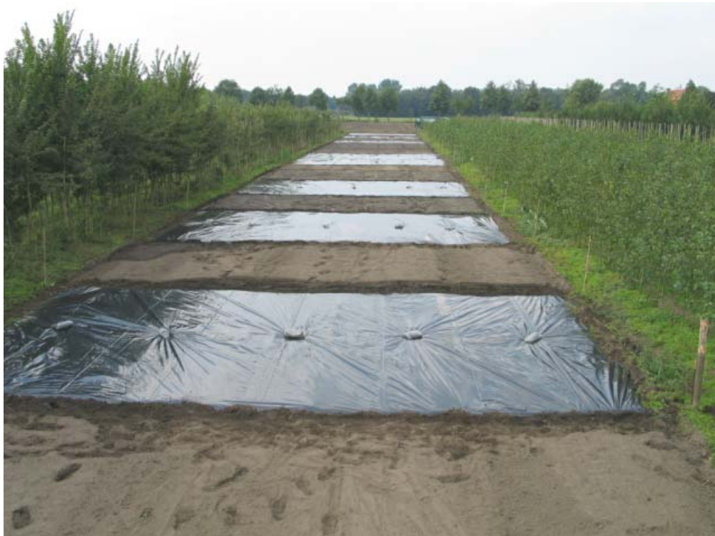
Abb. 8: Bodenentseuchungsversuch am 23.8.2006.

Am 7.6. wurden in den Parzellen der Varianten 4 und 5 Sudangras ( Sorghum sudanensis ) bzw. Brauner Senf ( Brassica juncea ) eingesät. Im Falle des Senf wurde eine Sorte mit einem sehr hohen Gehalt an Glucosinolaten ausgewählt, die sich deshalb - laut Angaben des Züchters - durch eine besonders stark entseuchende Wirkung auszeichnen soll. Die Parzellen der übrigen Varianten wurden bis zum Zeitpunkt der Versuchsanlage weitgehend unkrautfrei gehalten. Am 23.8. erfolgte das Einmulchen der beiden Gründüngungsarten. Aufgrund der sehr trockenen Witterung wiesen die Senf-Parzellen einen sehr lückenhaften Aufwuchs auf, so dass zur Einarbeitung nur 1,0 kg Frischmasse / m 2 zur Verfügung standen. Sudangras wurde mit 4,0 kg Frischmasse / m 2 in den Boden eingearbeitet. Zur Beschleunigung des Rotteprozesses, wurde der Boden mit 10 l Wasser / m 2 angefeuchtet. Schließlich wurden die Parzellen mit schwarzer Silagefolie abgedeckt (Abb. 8), um die Verweildauer der während des Abbaus entstehenden toxischen, meist flüchtigen Verbindungen im Boden zu verlängern bzw. ihre entseuchende Wirkung zu erhöhen. Am gleichen Tag wurde in der Variante 2 gemäß Versuchsplan (Tab. 16) Basamid Granulat gestreut und eingefräst. Anschließend wurde der Boden praxisüblich angewalzt, um die Verweildauer des gasförmigen Wirkstoffes im Boden zu verlängern. In Variante 3 wurde gemahlener Kalkstickstoff ausgebracht und eingefräst.