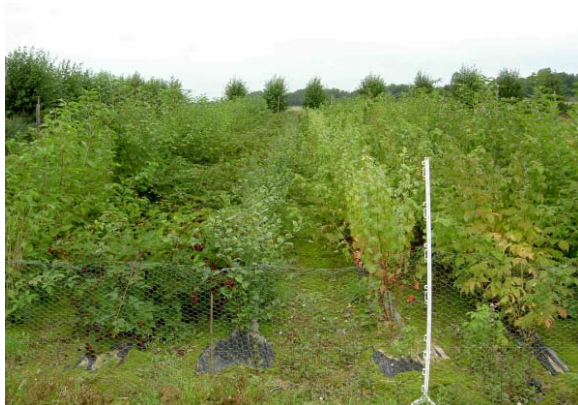
Abb. 6: Obstgehölzversuch Langförden

Der Infektionsversuch wurde mit dem Verticillium dahliae -Isolat 107/98 aus der Sammlung der Fachhochschule Osnabrück, das sich in früheren Versuchen als pathogen an Himbeere erwiesen hatte, durchgeführt. Nach einer Wurzeltauchinokulation wurden jeweils 18 Pflanzen pro Gehölzart am 7.4.2005 in schwarze PE-Folie mit einem Abstand von 0,33 m in der Reihe aufgepflanzt. Der Reihenabstand betrug 1,0 m. Eine gleich große Zahl von Pflanzen wurde nicht inokuliert und als Kontrolle aufgepflanzt.