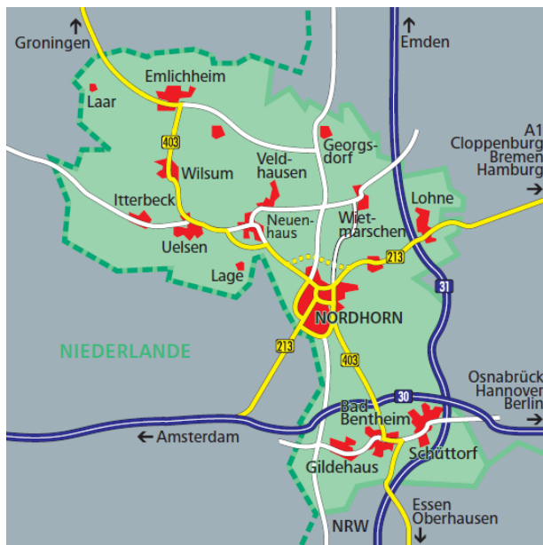
Abbildung 2: Karte Landkreis Grafschaft Bentheim (Landkreis Grafschaft Bentheim 2016)

Mit 137.068 Einwohnern und einer Fläche von 980,87 Quadratkilometer gehört der Landkreis Grafschaft Bentheim zu den vergleichsweise dünn besiedelten Regionen in Deutschland. Der Landkreis Grafschaft Bentheim gliedert sich in die Städte Bad Bentheim und Nordhorn, die Gemeinde Wietmarschen sowie in die vier Samtgemeinden Emlichheim, Neuenhaus, Schüttorf und Uelsen. Kreisstadt und größte Stadt des Landkreises ist Nordhorn mit 53.597 Einwohnern (Stand 2019; Landkreis Grafschaft Bentheim 2020). Der Landkreis liegt direkt an der deutsch-niederländischen Grenze. Die Niedergrafschaft ragt größtenteils in das Nachbarland hinein. Im Norden und Osten grenzt der Landkreis Grafschaft Bentheim an den niedersächsischen Landkreis Emsland und die Obergrafschaft im Süden an Nordrhein-Westfalen, wie auf der folgenden Grafik erkennbar ist: