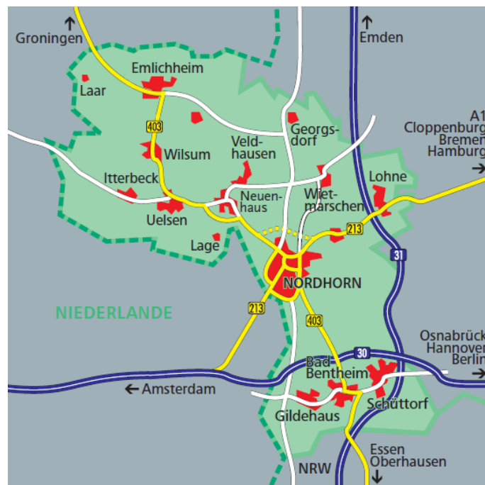
Abb.1: Grafik des Landkreises Grafschaft Bentheim

Der Landkreis Grafschaft Bentheim liegt direkt an der deutsch-niederländischen Grenze. Die Niedergrafschaft ragt größtenteils in das Nachbarland hinein. Im Norden und Osten grenzt der Landkreis an den niedersächsischen Landkreis Emsland und die Obergrafschaft, im Süden an Nordrhein-Westfalen wie auf der folgenden Grafik erkennbar ist (Landkreis Grafschaft Bentheim 2016).